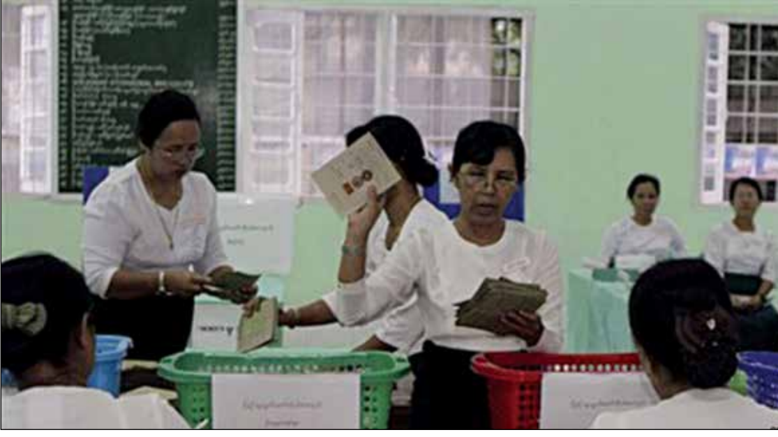
MHW ဦးစီးသည့် ၂၀၁၀ ရွေးကောက်ပွဲနှင့် စာလျှင် လာမည့် ၂၀၁၅ ရွေးကောက်ပွဲ မျှော်လင့် ပို၍ သန့်ရှင်းမျှတသည့် ရွေး ကောက်ပွဲဖြစ်လာလိမ့်မည်ဟု မျှော်လင့် ကြောင်း ဗမာပြည်သူ့ပါတီဥက္ကဋ္ဌ ဦး

အောင်သန်းတင်က ဇူလိုင် ၁၆ ရက်တွင် လူထုပုံရိပ်သို့ ပြောသည်။ “NLD ပါတီဝင်ပြိုင်မယ်ဆိုတာတည်း က ရလဒ်ကောင်းမယ်လို့ မျှော်လင့်ပါ တယ်” ဟု ၎င်းက ပြောသည်။ “ကျွန်တော်တို့ ပါတီက FDA နှင့် ပူးပေါင်းပြီး ရန်ကုန်တိုင်းမှာ မဲဆန္ဒနယ် (၃၀) လောက်ဝင်ပြိုင်မှာပါ။ ကိုယ်စား လှယ်တွေကိုတော့ စိစစ်နေတုန်းပါပဲ” ဟု ဗမာပြည်သူ့ပါတီဥက္ကဋ္ဌဦးအောင်သန်းတင် က ဆိုသည်။ မကွေးတိုင်း တောင်တွင်းကြီးတွင် ၄ နေရာ၊ ပြည်နယ် ၅ ခုတွင် တိုင်းရင်း သားနေရာ ၅ နေရာ၊ စုစုပေါင်း ၁၅ နေရာ ဝင်ရောက်ယှဉ်ပြိုင်မည်ဖြစ်ကြောင်း သိရ သည်။ “တစ်နိုင်ငံလုံး အတိုင်းအတာတော့ မယှဉ်ပြိုင်နိုင်ပါဘူး။ စုစုပေါင်း အများဆုံး မဲဆန္ဒ ၂၀ လောက်တော့ ဝင်ပြိုင်မှာပါ”