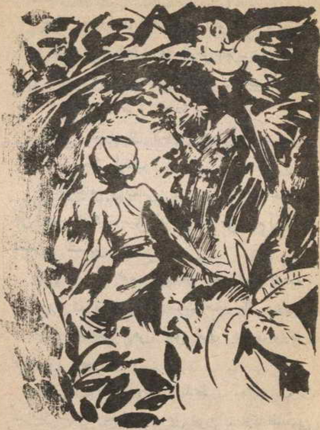
سار ، لال ، أمامهم وسط الغابة وهو يقف في خفة القروء .

وفي هذه اللحظة . صدرت صيحة مكتومة عن « عالية » . وقالت وهي تتصنع البكاء : آه . . آه . . لقد